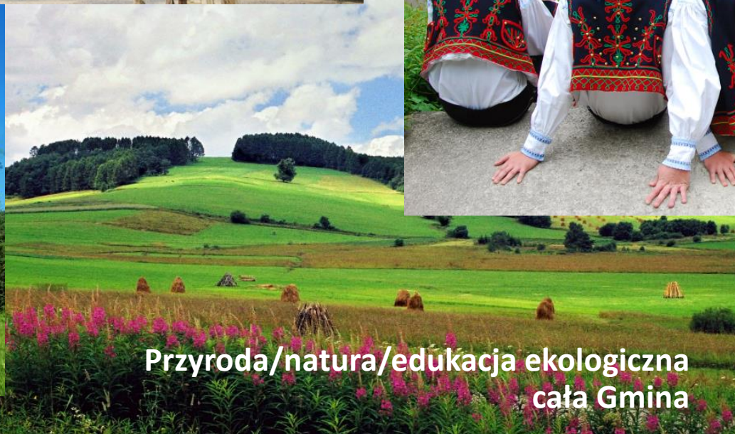
Przyroda/natura/edukacja ekologiczna cała Gmina