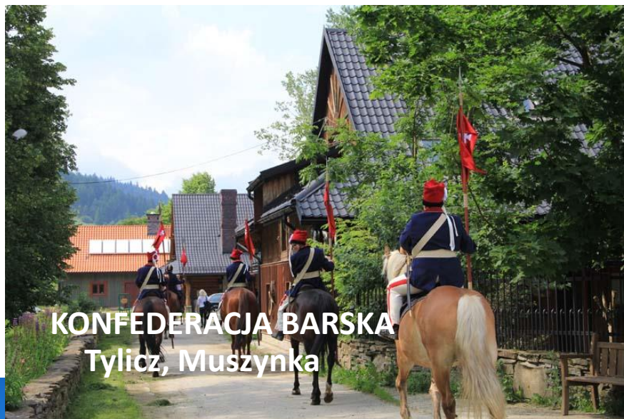
KONFEDERACJA BARSKA Tylicz, Muszynka